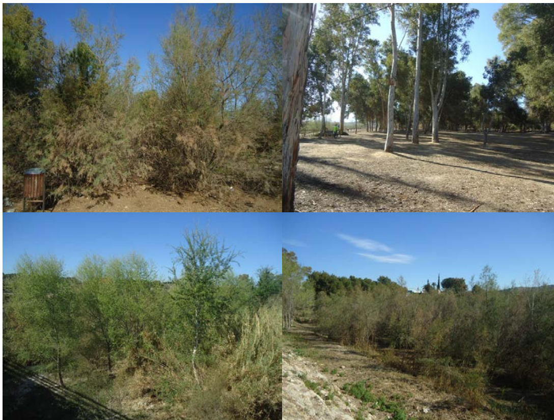
Imagen 2. De izquierda a derecha y de arriba abajo. Área de campeo 1. Bosque de ribera (alameda)