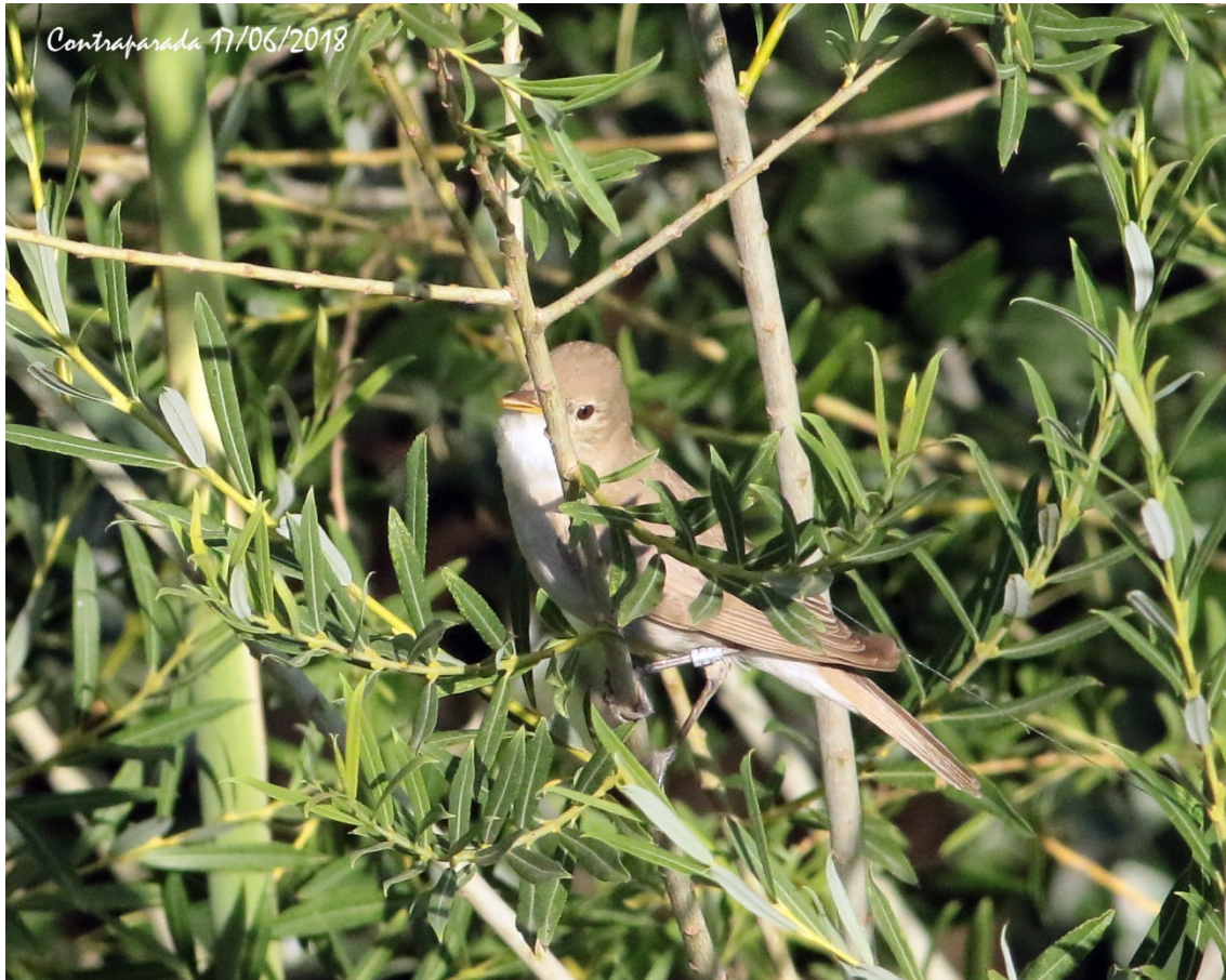
Imagen 1. Ejemplar de zarcero bereber ( Iduna opaca ) objeto de seguimiento (P178139). Se aprecia la anilla metálica y la antena del emisor. El ejemplar se encontraba sobre un sauce rojo ( Salix purpurea ) implantado en el marco de un proyecto de recuperación de la vegetación de riberas.

El método de sujeción elegido fue el método el de un arnés en forma de lazo sujeto a las patas del ave (leg-loop harness en inglés), que se ha mostrado como un método muy eficaz e inocuo en aves paseriformes (Rappole y Tipton, 1991). El tamaño del arnés fue calculado según la función alométrica propuesta por Naef-Daenzer (2007).