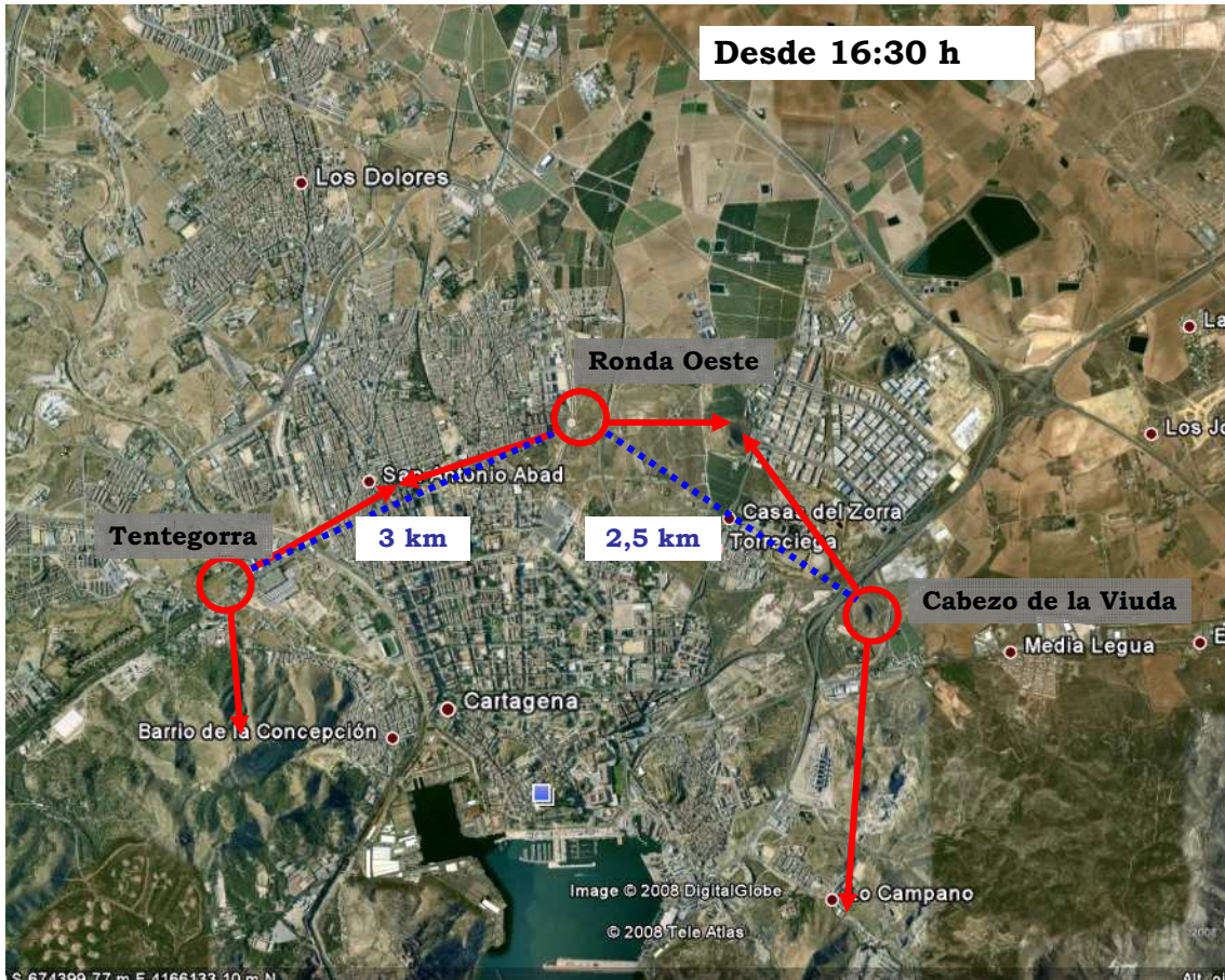
Mapa. Ciudad de Cartagena y distribución de las estaciones de censo (en círculo).