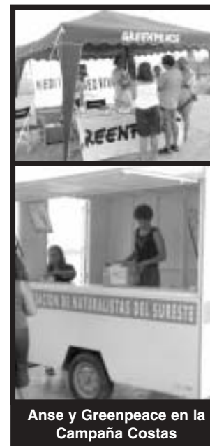
Anse y Greenpeace en la Campaña Costas

La Delegación Local de Murcia dedicó este año la celebración del día Mundial del Medio Ambiente a la "Defensa del Litoral de la Región de Murcia", motivo por el cual organizó el Miércoles, día 5 de junio, una Exposición en la Calle (Plaza de Sto. Domingo) sobre las "Agresiones al Litoral de la Región de Murcia" con el que pretendía infor-