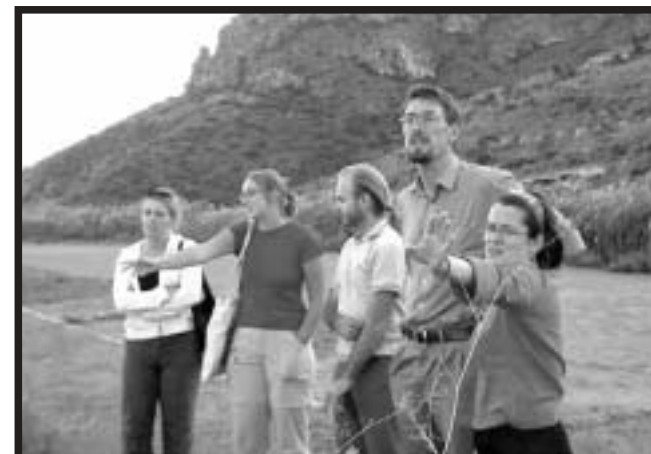
Anse-Murcia muestra a miembros de Adena/WWF el avance de la desertización y la destrucción de la huerta.

Por otro lado, se criticaron diversos aspectos del proyecto por cuanto que, pese a la trascendencia de algunas de sus actuaciones (Estadio de Fútbol, Campo de Golf, urbanización del entorno, etc.), no se habían previsto adecuadamente medidas tendentes a una gestión ade-