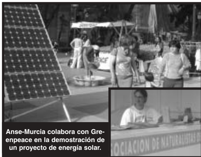
Anse-Murcia colabora con Greenpeace en la demostración de un proyecto de energía solar.

Con este acto ANSE pretendía denunciar la situación de abandono en que se ha dejado la red de ferrocarriles de la Región de Murcia por parte de Renfe, Feve, la Comunidad Autónoma de la Región de Murcia y el Ministerio de Fomento, así como reivindicar la realización de nuevas inversiones en el mantenimiento de la misma y la puesta en marcha de un programa de actuaciones tendentes a la extensión de la red ferroviaria convencional. En este sentido, ANSE viene reclamando la prolongación de la línea de FEVE hasta Cabo de Palos y San Pedro del Pinatar; la reapertura de la línea Lorca-Andalucía; la creación de una línea de Cercanías Murcia-Alcantarilla-Campus Universitario-Molina de Segura-Alguazas-Cieza; el desdoblamiento y electrificación de las líneas Lorca-Murcia-Alicante y Albacete-Murcia-Cartagena, con la consiguiente adecuación de las mismas para la Velocidad Alta (Trenes como el Euromed) -que genera menos impactos ambientales que la Alta Velocidad (AVE).