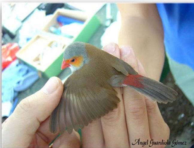
Estrilda de carita naranja. Contraparada 7-10-2007

Especie exótica reproductora próxima al establecimiento. Originaria de África. Introducida principalmente de forma accidental (escape de individuos cautivos).