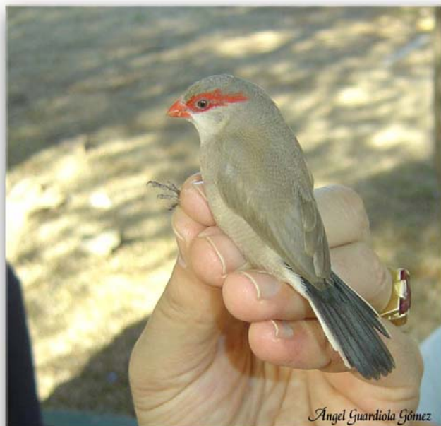
Estrilda culinegra. Contraparada. 12-11-2006

Especie exótica reproductora próxima al establecimiento. Originaria de África. Introducida principalmente de forma accidental (escape de individuos cautivos).