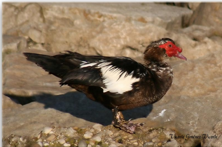
Pato criollo. Río Segura. 11-6-2008

Especie (variedad) exótica, con reproducción registrada. Origen doméstico (modificada por selección artificial) a partir de especie originaria de Centro y Sudamérica. Introducida principalmente como ave ornamental.