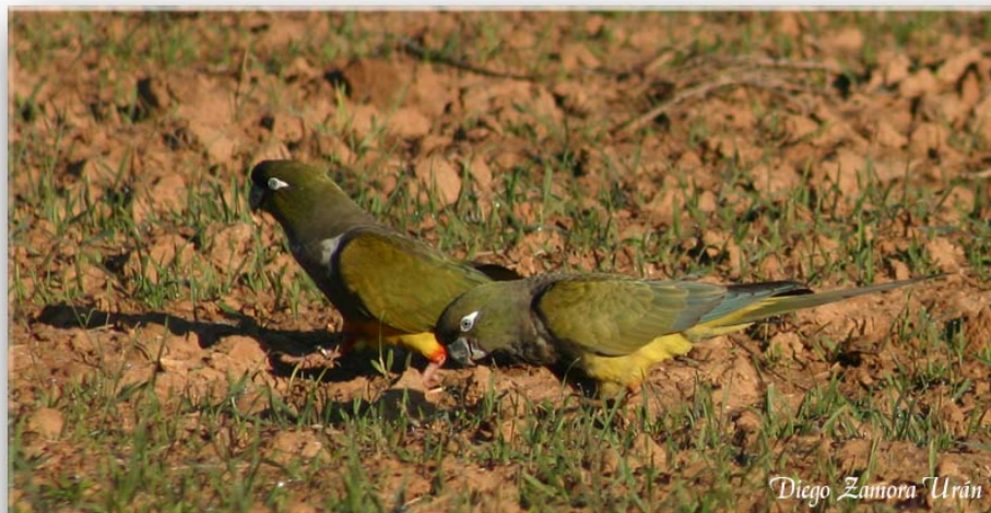
Loro barranquero. Salinas Marchamalo. 9-2-2006

Especie exótica, observada de forma ocasional. Originaria de Sudamérica. Introducida principalmente de forma accidental (escape de individuos cautivos).