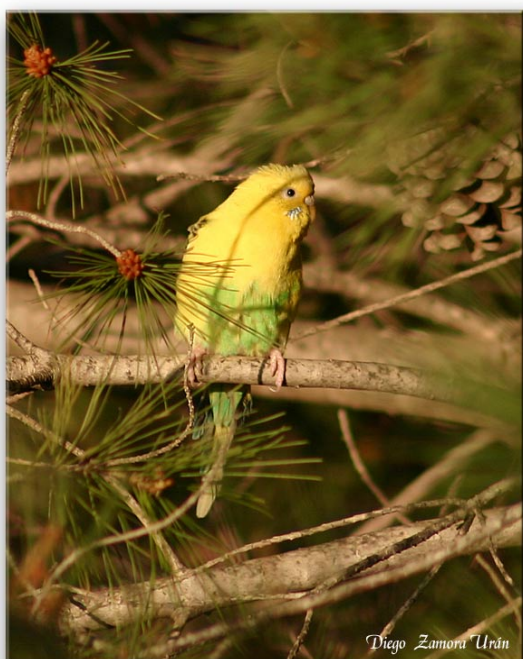
Periquito común. Tentegorra. 24-3-2006

Especie exótica, con reproducción registrada.