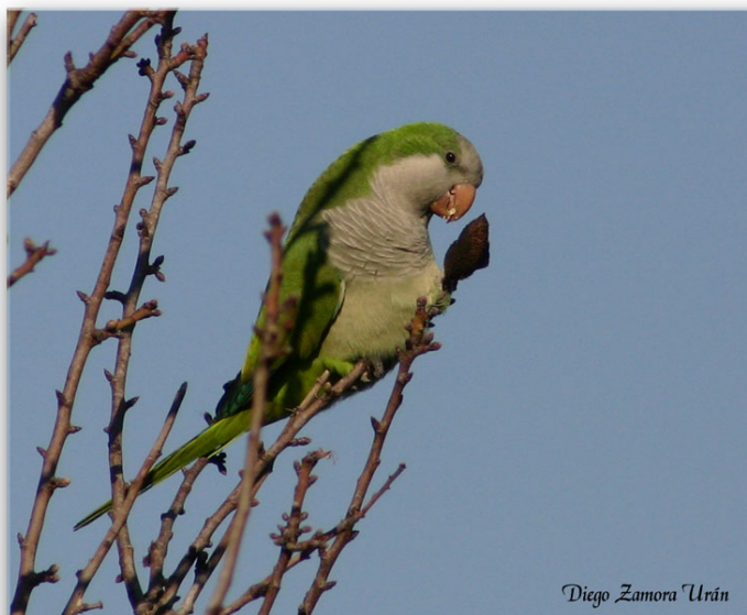
Cotorra argentina. Tentegorra. 6-1-2007

Especie exótica establecida. Originaria de Sudamérica. Introducida principalmente de forma accidental (escape de individuos cautivos).