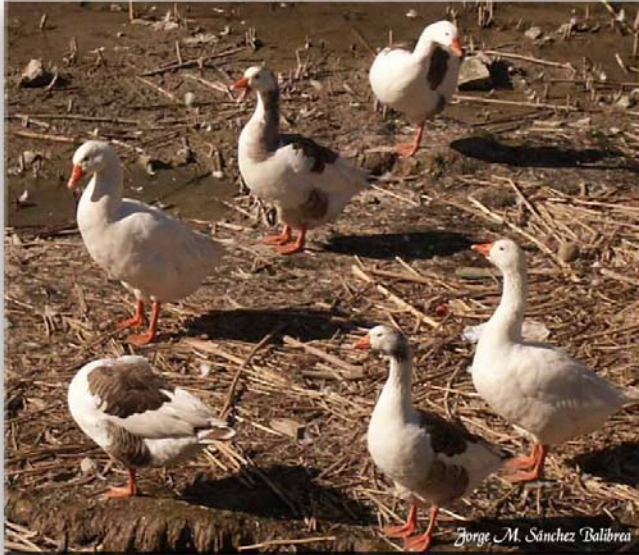
Ánsar común - var.doméstica. Río Segura.

Especie (variedad) doméstica observada de forma ocasional.