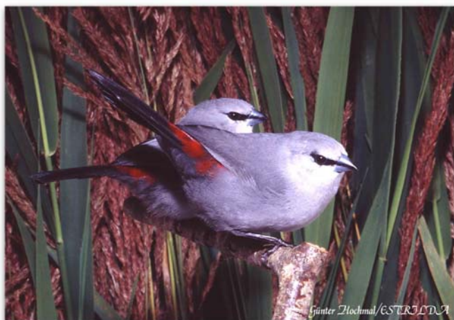
Estrilda de cola negra

Especie exótica, con reproducción registrada.