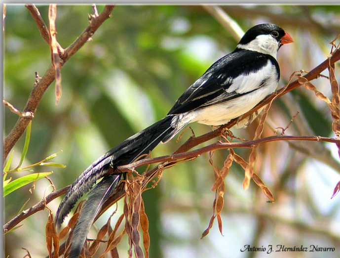
Viuda colicinta. Jardines Santa Ana, 27-7-2005

Especie exótica, observada de forma ocasional. Originaria de África.