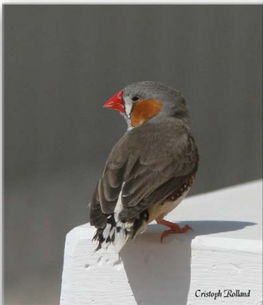
Diamante Moteado de Australia. Los Narejos. 19/3/2008

Especie exótica, con reproducción registrada. Originaria de Australia. Introducida principalmente de forma accidental (escape de individuos cautivos).