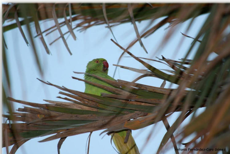
Cotorra de Kramer. La Manga. 15-8-2008

Introducida principalmente de forma accidental (escape de individuos cautivos).