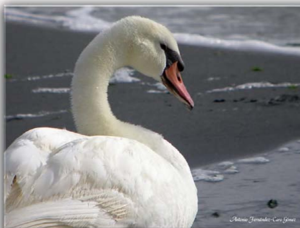
Cisne vulgar. Mar Menor. 15-7-2007

Especie nativa, aunque también con ejemplares introducidos con reproducción registrada. Introducida principalmente como ave ornamental.